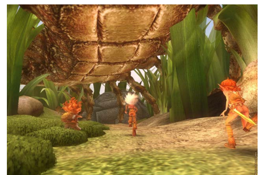
Arthur et les Minimoies, film de Luc Besson 2006

Pour comprendre les effets spéciaux (pas de numérique à l'époque) http://rockyrama.com/super-stylo-article/sur-le-tournage-de-cherie-jai-retre-ci-les-gosses