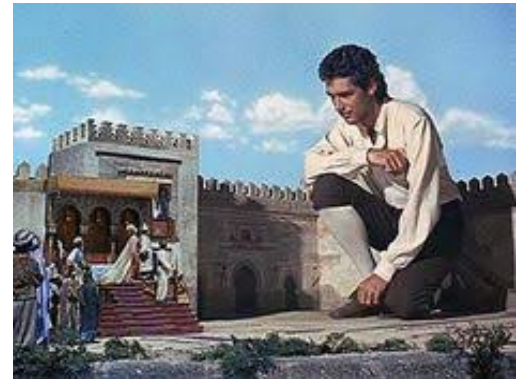
Le Voyage de Gulliver, film de Jonathan Swift 1960