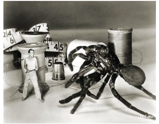
L'Homme qui rétrécit, film de Jack Arnold 1957