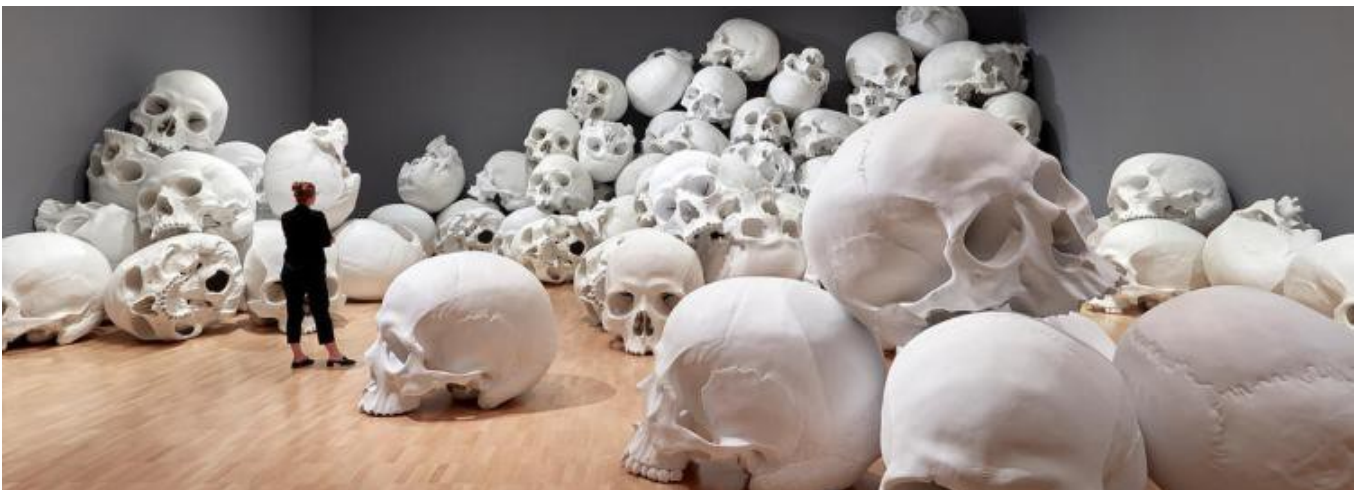
Ron Mueck Mass 2017 (vanité)