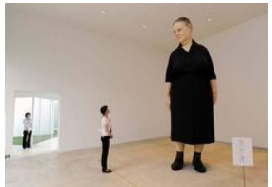
Ron Mueck Femme debout 2011