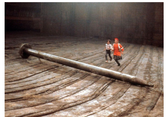
Chérie, j'ai rétréci les gosses, film de Joe Johnston 1989

Bande annonce: https://www.dailymotion.com/video/x3lx6ar