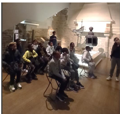
Photo : Les joueurs attentifs à l'histoire de la Traite Atlantique

La visite se poursuit vers la salle où sont entreposées les premières cartes de navigation vers la Guinée. On y trouve aussi une toile immense d'un des premiers commerçants d'esclaves du port de Nantes. Les joueurs sont surpris du blason (mot qu'ils viennent d'apprendre) de ce commerçant, représentant deux sirènes et une tête de dauphin. Un blason qui montre la capacité du commerçant à naviguer en direction de l'Afrique pour participer à ce bien triste commerce. Les joueurs restent silencieux face à cette information, il est temps de monter dans les salles à l'étage pour voir comment sont négociés et transportés les esclaves africains vers les colonies antillaises.