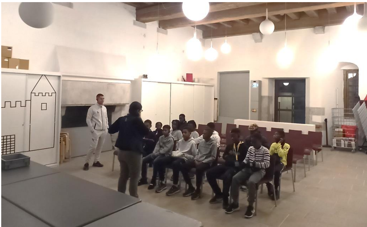
Photo : Les joueurs guyanais écoutant attentivement la guide pendant son introduction sur la visite qui va suivre