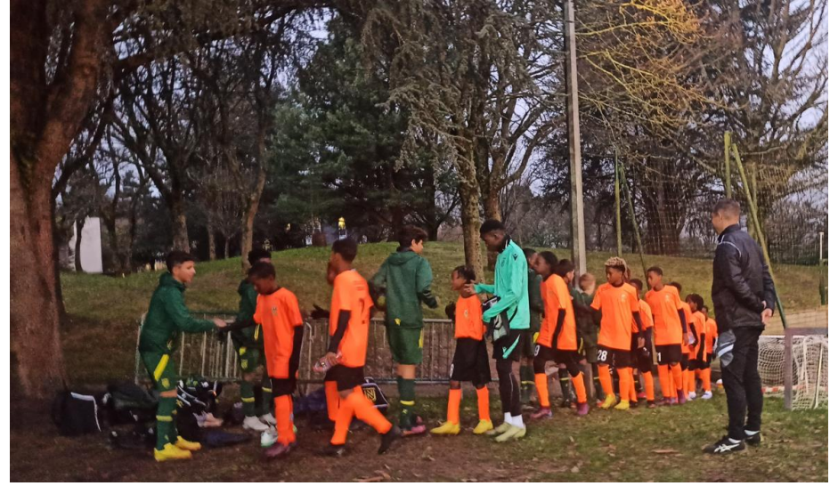
Photo : Premier contact entre les joueurs Guyanais et Nantais qui se saluent avant de commencer l'échauffement

Le match final a opposé des joueurs très motivés qui voulaient montrer de quoi ils étaient capables. Un match qui c'est déroulé sous les yeux des coéquipiers, ravis de pouvoir encourager leur camarade.