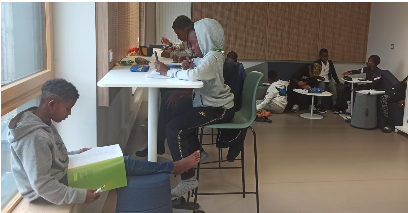
Photo : Les joueurs de l'équipe en pleine fièvre mathématique