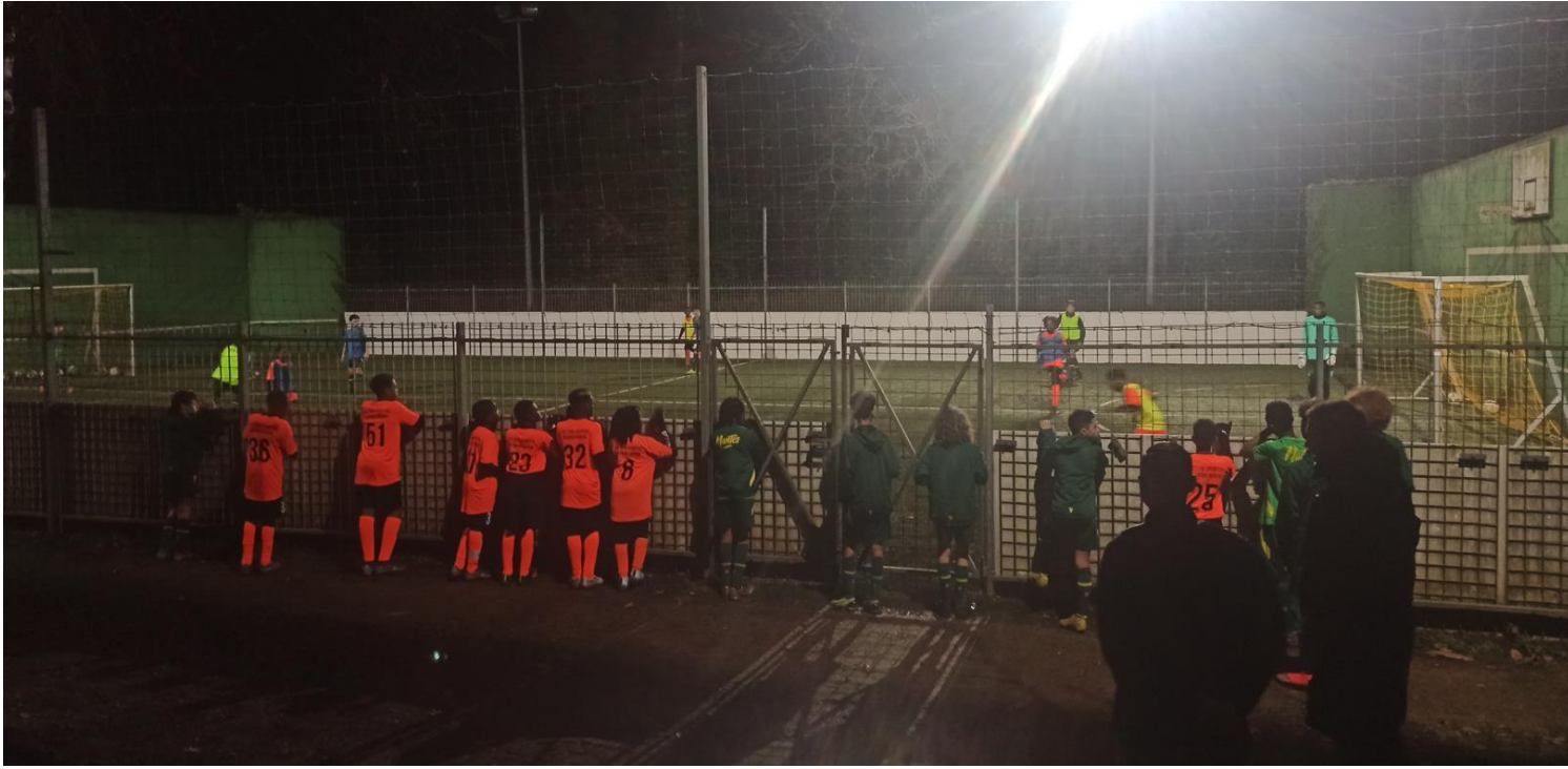
Photo : Les joueurs Nantais et Guyanais en train d'observer le match final qui oppose leur camarade