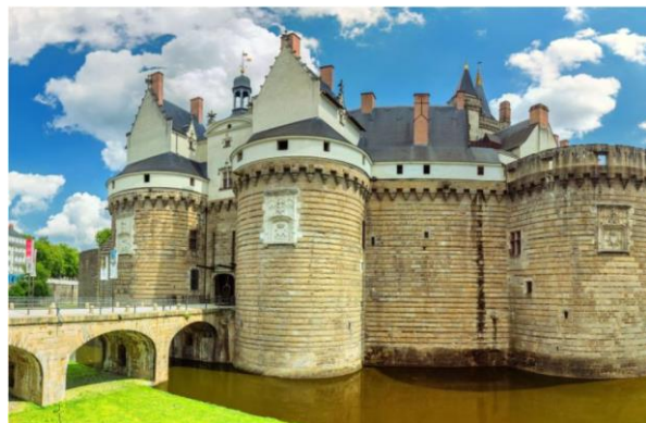
Photo : Le château des ducs de Bretagne à Nantes (photo non contractuelle)